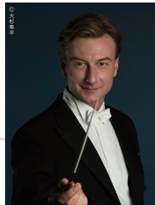
クリスティアン・アルミンク「指揮」