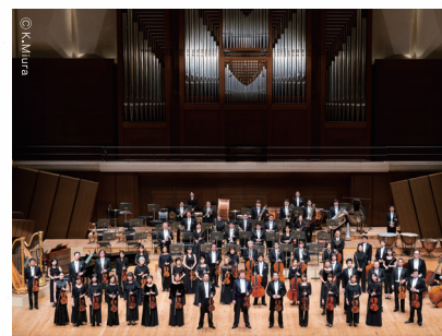
新日本フィルハーモニー交響楽団